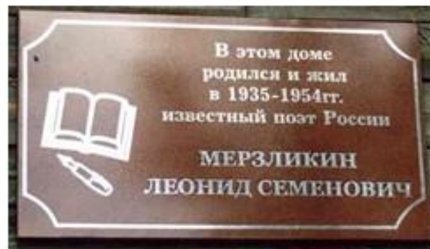
Памятная доска на доме